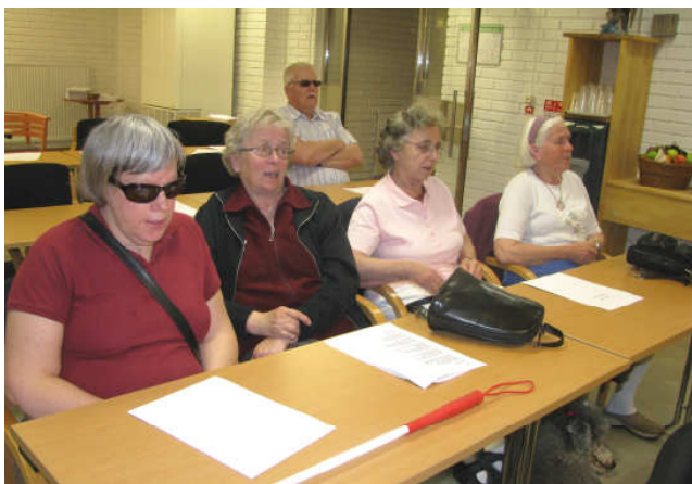
Förhandlingar vid årsmötet i Ramnäs.

Den ekonomiska förvaltningen av värdepapper har under 2009 varit positiv. Till verksamheten har från värdepappersfonden tillförts 1.546.691 kr medan övriga intäkter från bidrag och gåvor uppgick till 668.003 kr. Detta visar att föreningens verksamhet är mycket starkt beroende av den avkastning som värdepappersportföljen kan generera.