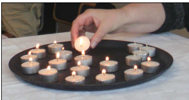
Ljuständning vid parentationen i årsmötet i maj.