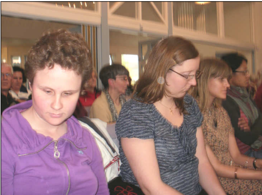
Från konserten i Apelvikshöjds kyrka.