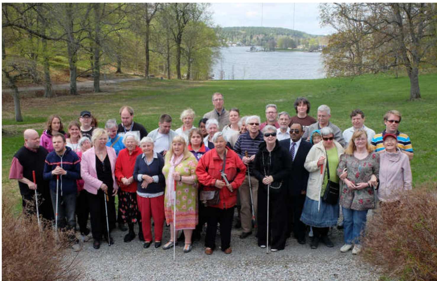
Deltagarna på årsmötet 2013.