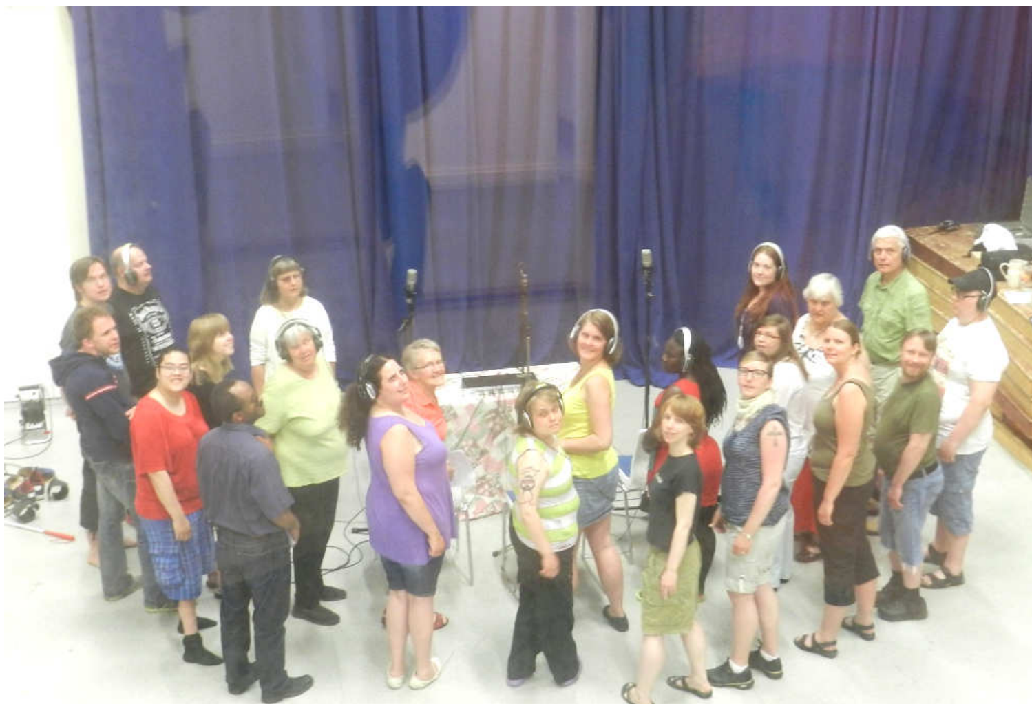
Körgänget i studion för att spela in Syskonbandets Musik-CD.

Medlemstidning för Kristna synskadades förening Syskonbandet