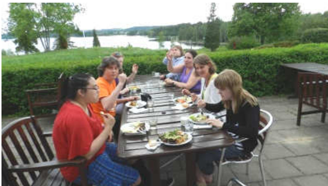
Matrast i härlig omgivning.

tacobuffé var det dags för uppsjuning där det bland annat bjöds på musikmemory och sånger om grodor. Efter uppvärmning av röster var det äntligen tid för kören att börja öva tillsammans på de fyra körspår som skulle spelas in. Vi började lite mjukt med en finstämd låt skriven av Trygve Nandorf, där skulle kören bara "oa" lite lätt. Det