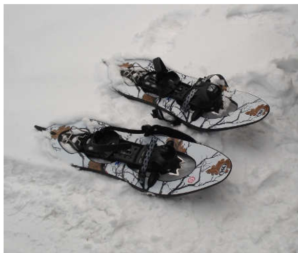
I Härnösand fick vi prova på att gå med snöskor.

kosta bygget av toaletter intill BCA:s nyrenoverade byggnad. Insamlingsmålet uppnåddes och bygget har påbörjats. Det årliga föreningsstödet sänktes något detta år. Föreningen UFSAMC i Kongo har framlagt den tidigare ansökan om bidrag till byggnadsprojekt som aktuell även i år. Styrelsen har jobbat vidare med frågan men ej beslutat att gå in för insamling och stöd i detta projekt. Ökat föreningsstöd har getts till UFSAMC i år. Fjolårets försändelse med hjälpmedel till blindskolan Shule ya Furaha i Tanzania nådde fram välbehållet. Det ekonomiska stödet till föreningen TCAB och till Kibreli litteraturarbete förblev det samma i år som tidigare år.