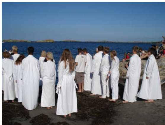
Dop på Hönö.

deltog i gudstjänster, ungdomsmöte, seminarium och bönemöte som konferensprogrammet erbjöd. En deltagare lät sig döpas under dagarna och hela gruppen deltog i denna stund tillsammans med folkmassan på stranden. 12 personer deltog på detta läger.