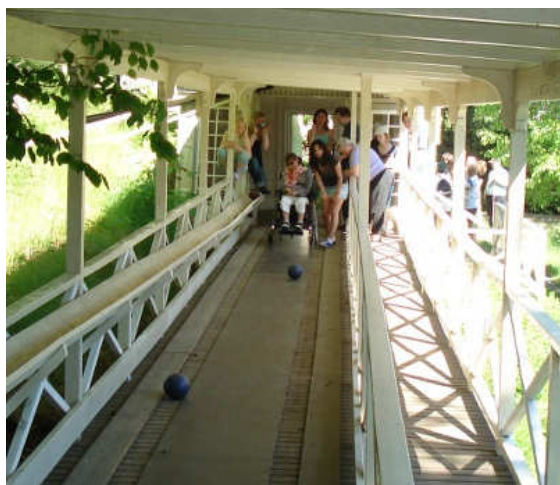
Utomhusbowling var en aktivitet på Tollare.