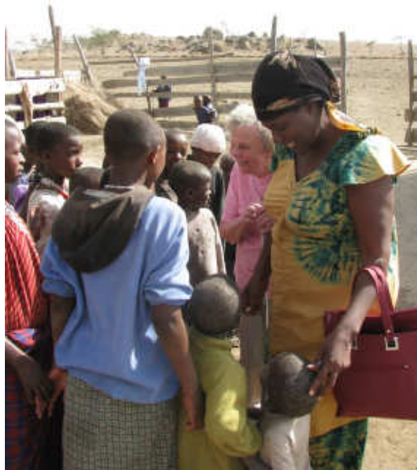
Tanzania, foto: Enar Olsson

Detta är bara ett exempel på vad Syskonbandets mission bland synskadade i Afrika är med och stöttar. Tyvärr har insamlingen så här långt i år gått trögt. Vi gör därför detta upprop till dig som har möjlighet att bidra till vår missionsinsamling. Med denna tidning finns det ett inbetalningskort till vårt plusgiro 36 449-7.