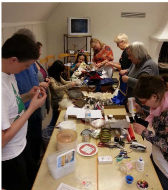
Massor med material att välja på.

tillsammans med det kristna studieförbundet Bilda håller sådana här kurser. Hon hade tagit med sig en enorm mängd med material: ull från de egna fåren, tyger, papper, kulor, paljetter och mycket mer. Hon hade valt ut Psalm 139 som börjar med: "Herre, du rannsakar mig och känner mig" som vi fördjupade oss i och skapade små konst-