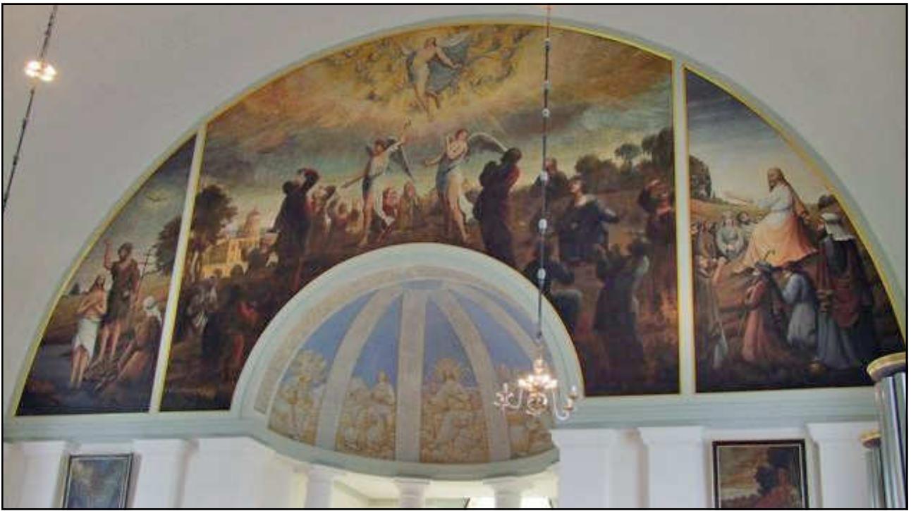
Takmålningar från Östra Husby kyrka.