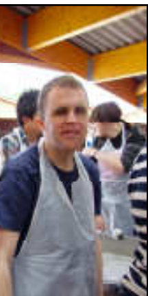
Oscarsson ndesson i n i Taizé.