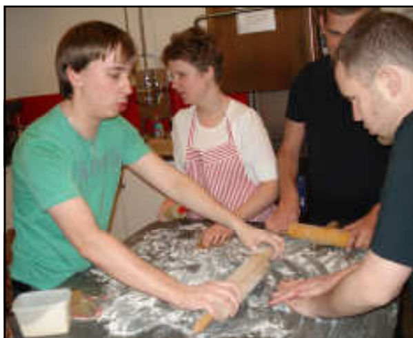
Pepparkaksbakning vid ungdomshelgen i Högdalskyrkan i november.