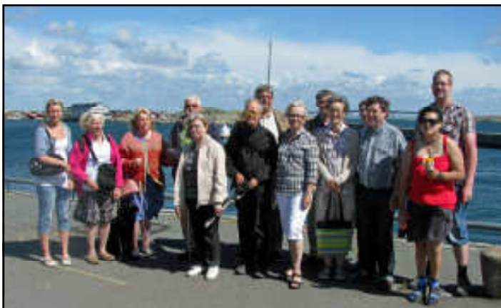
Ett gäng "syskonbandare" möttes en dag vid Hönökonferensen i juli.