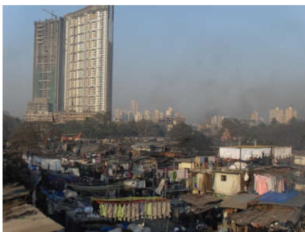
Marknad i Mumbai.

Sheela var just en sådan kvinna, hon kom till Mumbai för att söka arbete för att kunna försörja sin familj. Istället blev hon lurad, neddrogad och vaknade upp i en bordell. En natt, som vilken som helst, kom det en man till henne. För bara några kronor hade han köpt en halvtimme av hennes natt, men istället så ville han bara sitta och prata.