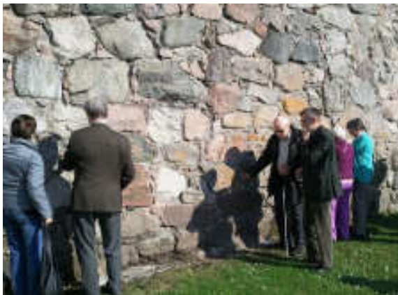
Inspektion av muren.

Kvar sedan den tiden finns en del höga och skrovliga murar som vi fick känna på.