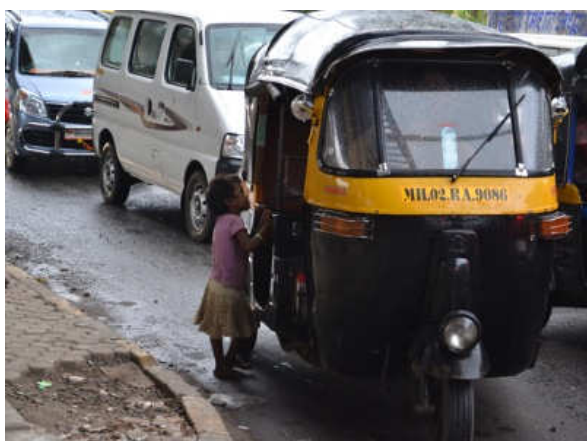
Flicka som tigger på gatan i Mumbai.