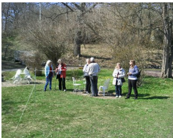
Paus i trädgården.