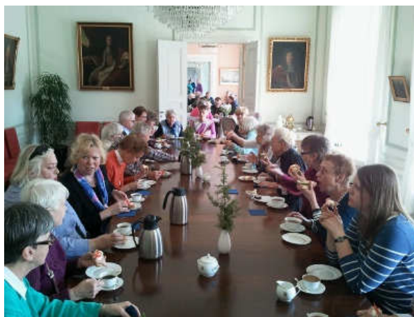
Kaffe och smörgås på residenset.

vägen för fartygen till sjöss vill kyrkan visa vägen till Gud och påminna om hans goda avsikter med oss. Stå där på berget och ständigt skydda livet, varna för livets risker och visa vägen till det goda livet som gjorts möjligt genom Jesus Kristus. Att kyrkan är byggd i betong har förundrat många. Ofta gömmer man betongen bakom puts eller plattor. I S:t Botvids kyrka framträder betongens egna värden - styrka, fasthet och äkthet." Här fick vi sjunga och fira andakt tillsammans och lyssna på en berättelse om kyrkan.