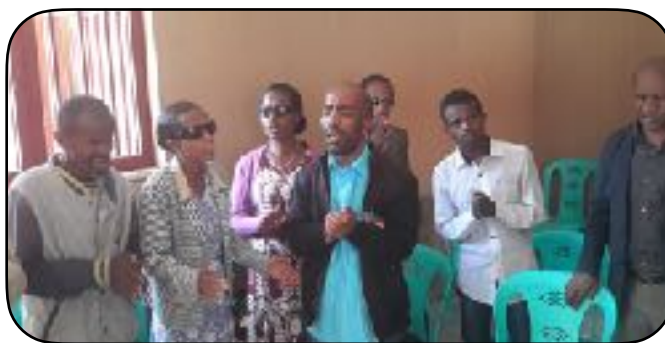
Psalmsång vid besök hos BCA i Etiopien i februari 2020.

Syskonbandets kansli och styrelse har fått rop på hjälp från våra systerorganisationer i Etiopien och Kongo Kinshasa. Organisationen i Tanzania har inte hört av sig med nödrop än, men det finns anledning att tro att även de är drabbade.