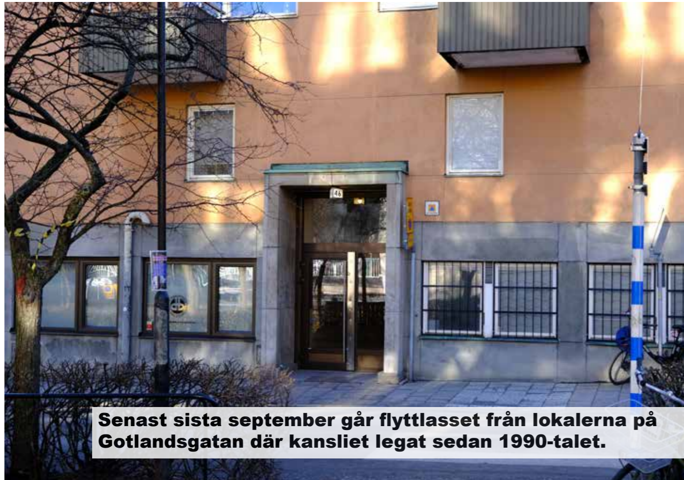
Senast sista september går flyttlasset från lokalerna på Gotlandsgatan där kansliet legat sedan 1990-talet.